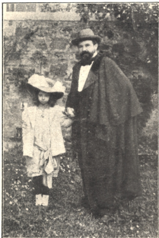
Feszty Árpád a kisleányával, Masával, aki most már maga is hírneves festő.